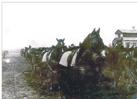
Ryc. 10. Zdjęcie bez ozdobnego obramowania, oryginalny wymiar 61 x 85 mm.