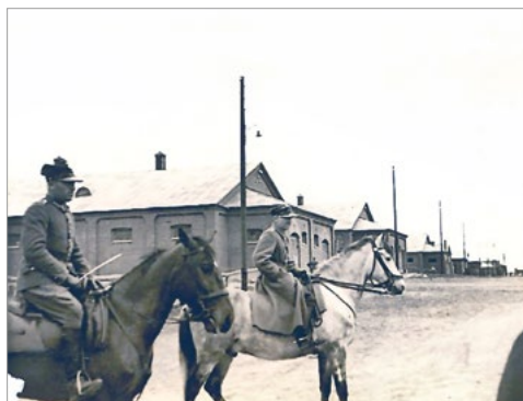
Ryc. 6. Zdjęcie bez ozdobnego obramowania, oryginalny wymiar 57 x 82 mm.