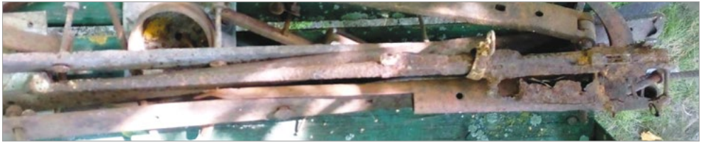
Ryc. 3. Destrukt na kupie złomu.

Głębokie wżery korozyjne na artefakcie czynią niemożliwym odczytanie jego numeru seryjnego (prawdopodobnie jest to możliwe przy zastosowaniu kosztownych badań metalograficznych, które obecnie wykonuje się dla najcenniejszych znalezisk sprzed tysiącleci). Tym samym udokumentowanie całej historii tego egzemplarza broni, od momentu jej wytworzenia, jest praktycznie niemożliwe.