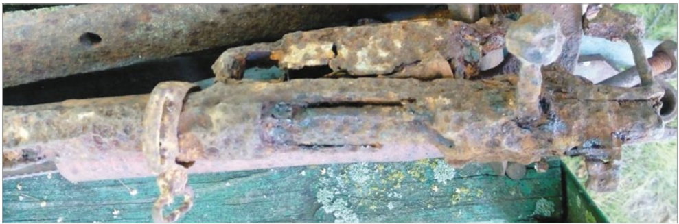
Ryc. 4. Widok prawej strony destrukt: komora nabojoowa, zamek i magazynek.