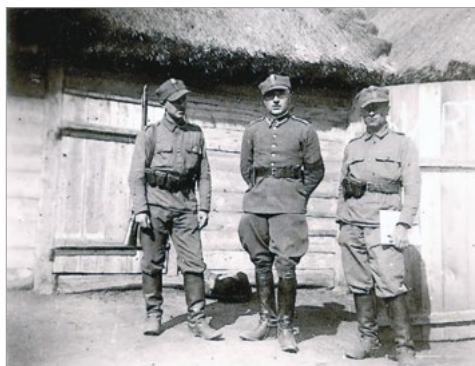
Ryc. 7. Zdjęcie z ozdobnym obramowaniem, oryginalny wymiar 61 x 85 mm.