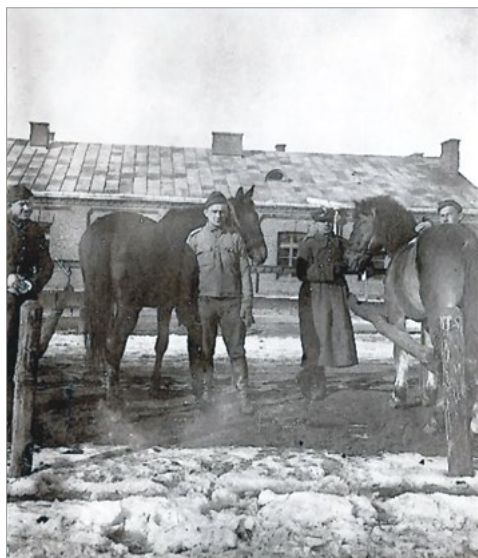
Ryc. 8. Zdjęcie bez ozdobnego obramowania, oryginalny wymiar 83 x 63 mm.