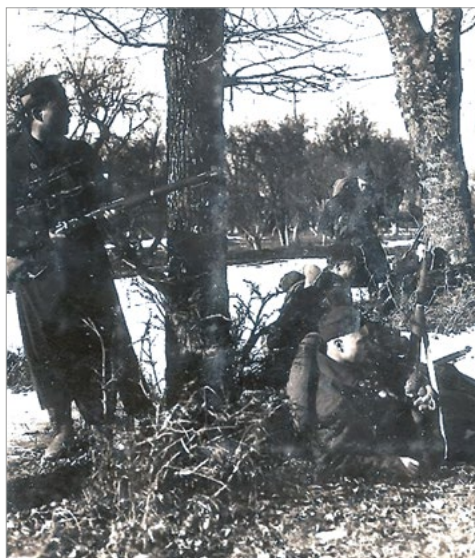
Ryc. 9. Zdjęcie bez ozdobnego obramowania, oryginalny wymiar 85 x 60 mm.