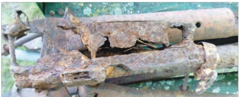
Ryc. 5. Widok z lewej strony: komora nabojoowa i magazynek.

W porzuconych na brzegu ubraniach pani Edwarda Kidaj znalazła zdjęcia, które w jej rodzinie przechowały się do dnia dzisiejszego.