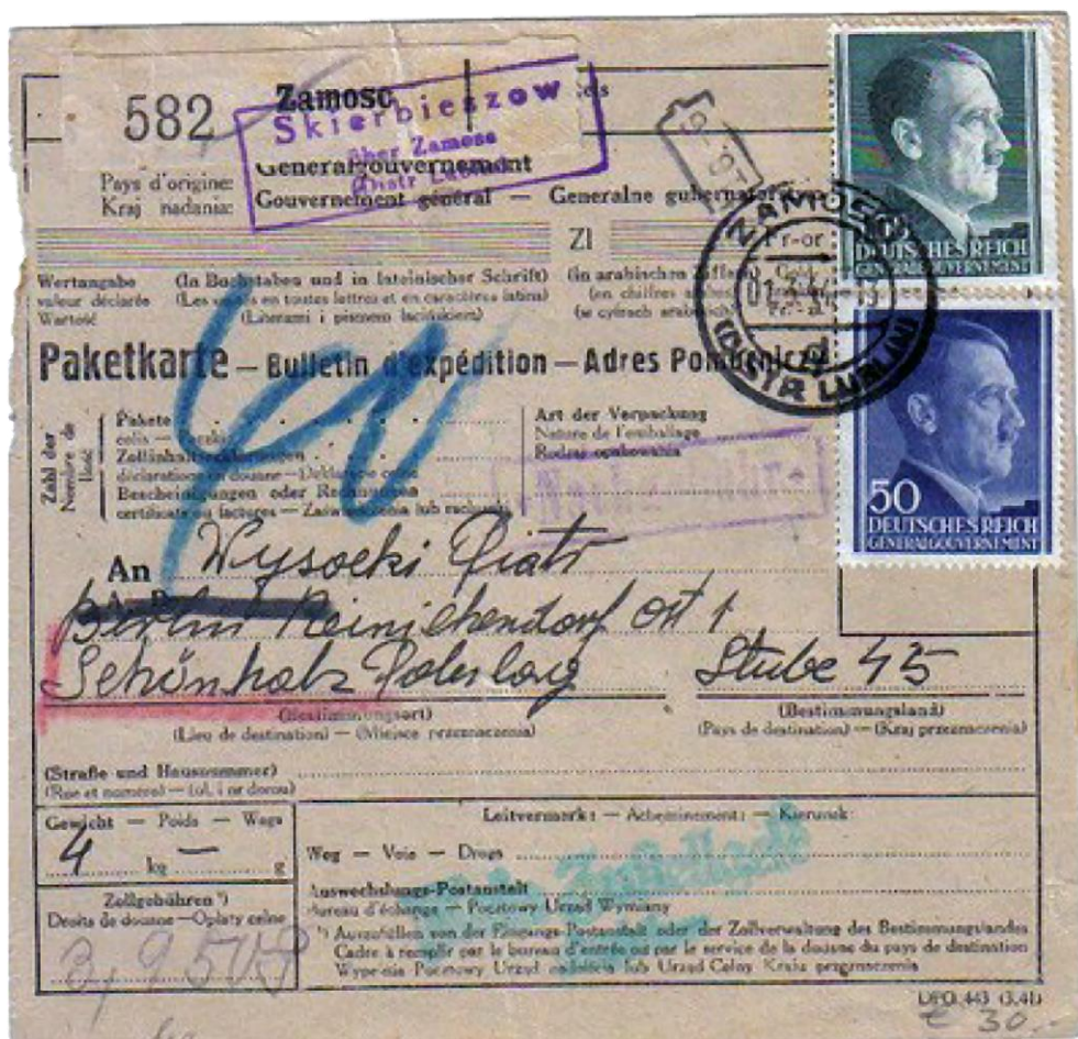
Ryc. 6. Koperty pocztowe ze stemplami punktów pośrednictw pocztowych Poststutzpunkt. Zbiory własne.