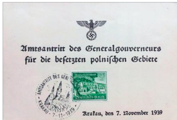
Ryc. 2. Karta pamiątkowa z okazji utworzenia Generalnego Gubernatorstwa, ofrankowana znaczkiem dobroczynnym na pomoc zimową Niemiec z 1939 r. (Amtsantritt des Generalgouverneurs, Krakau, 7 XI 1939).