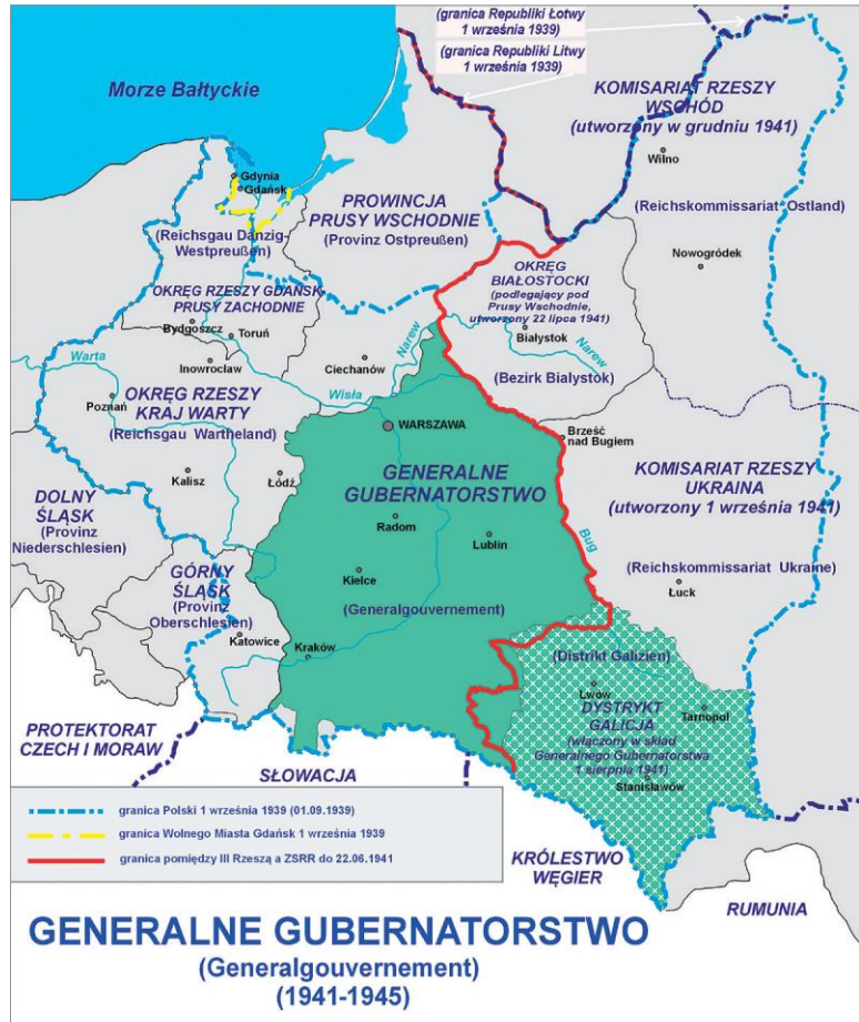
Ryc. 1. Mapa Generalnego Gubernatorstwa wg stanu na dzień 31 VII 1940 r.