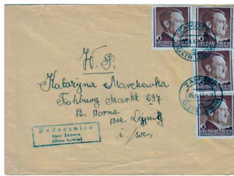
Ryc. 4. Przykład korespondencji z odciskami stempli agencji pocztowych DPO.