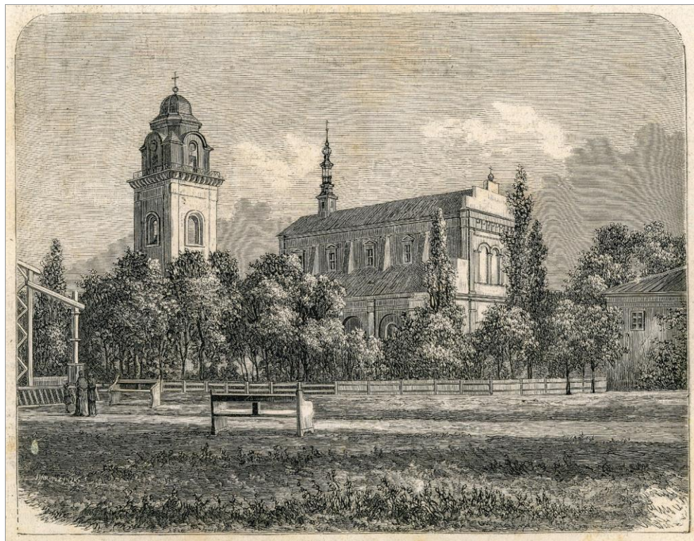
Ryc. 1. Kolegiata w Zamościu. Podług fotografii Strzeleckiego w Zamościu. Rycina autorstwa J. Jarmużyńskiego zamieszczona w „Tygodniku Ilustrowanym” z I półrocza 1878 r., s. 280. Nabytek Archiwum Państwowego w Zamościu z 2020 r.

W metrykach występują różne zawody związane z rzemiosłem. Określa się je zazwyczaj mianem mayster proffesyi . O powszechnym w ubiegłych stuleciach trybie nauki, istniejącym jeszcze w XIX w., świadczy podział na majstrów oraz czeladników 51 . Niektóre profesje mają nazwy łatwe do