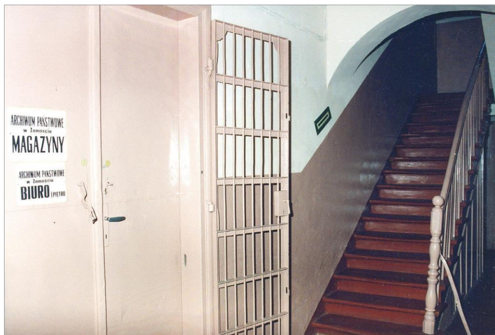
Ryc. 7. Klatka schodowa z wejściem do magazynów na parterze kamienicy przy ul. Moranda 4, ok. 1995 r. Autor NN. AP Zamość, Zbiór fotografii, sygn. 38.