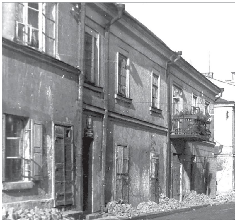
Ryc. 2. Siedziba Archiwum przy ul. Lenina 11 (dawniej ul. Grodzka), ok. 1960 r.