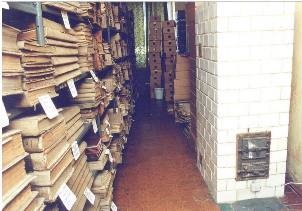
Ryc. 8. Magazyn w siedzibie Archiwum przy ul. Moranda 4, ok. 1995 r.