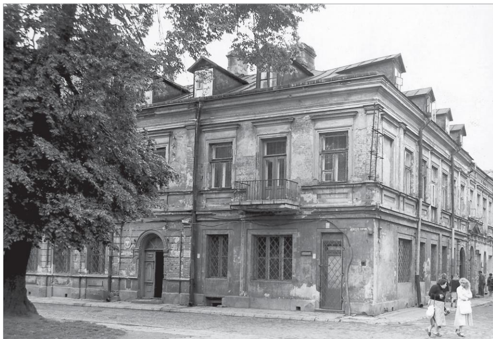
Ryc. 3. Siedziba Archiwum przy ul. Moranda 4, w zachodniej pierzei Rynku Wodnego, ok. 1985 r.