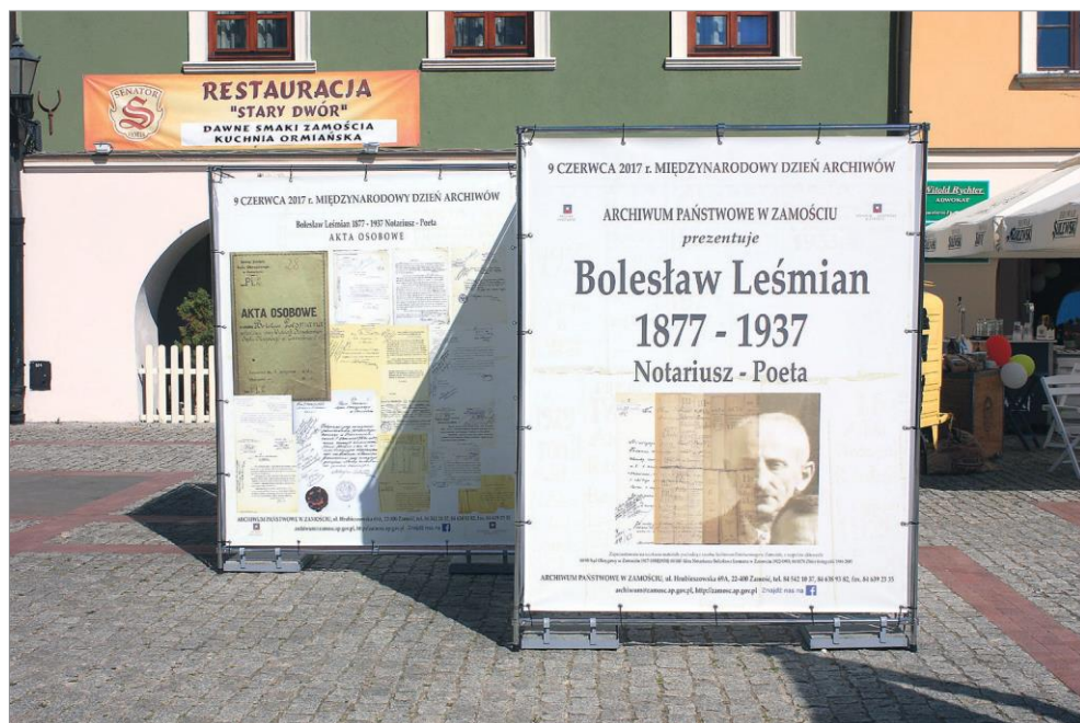
Ryc. 17. Wystawa plenerowa poświęcona Bolesławowi Leśmianowi, eksponowana na Rynku Solnym w Zamościu w ramach obchodów Międzynarodowego Dnia Archiwów, 9 czerwca 2017 r. Autor: Jakub Żygawski. Ze zbiorów Archiwum Państwowego w Zamościu.