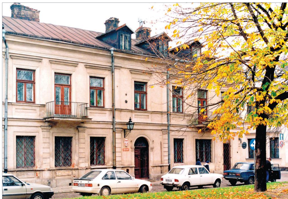
Ryc. 6. Widok z Rynku Wodnego na siedzibę Archiwum przy ul. Moranda 4, ok. 1995 r. Autor NN. AP Zamość, Zbiór fotografii, ser. 12, sygn. 37.