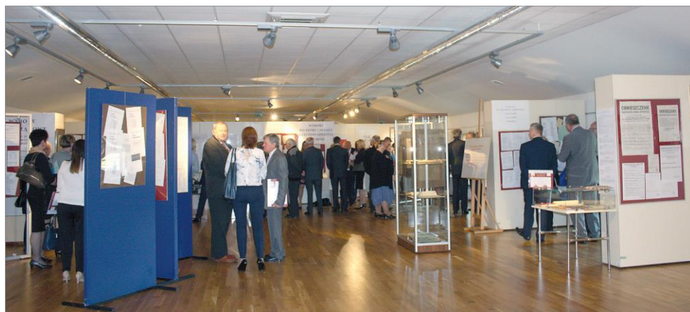
Ryc. 14. Wernisaż wystawy Wybory dawniej i dziś zorganizowanej w Muzeum Fortyfikacji i Broni „Arsenał” przez Komisarza Wyborczego w Zamościu, Muzeum Zamojskie w Zamościu i Delegaturę Krajowego Biura Wyborczego w Zamościu przy współpracy Archiwum Państwowego w Zamościu, 10 maja 2016 r. Autor: Anna Borucka. Ze zbiorów Archiwum Państwowego w Zamościu.