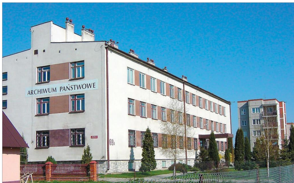
Ryc. 12. Budynek laboratoryjno-biurowy będący od 2001 r. siedzibą Archiwum Państwowego w Zamościu, 2005 r. Autor: Andrzej Kędziora. Ze zbiorów AP Zamość.