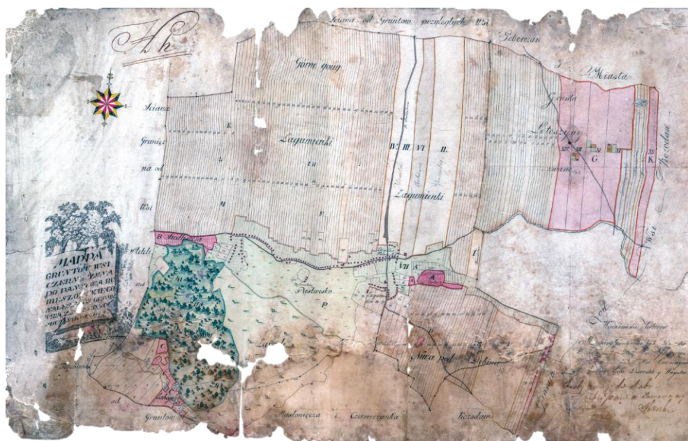
Ryc. 1. Najstarszy plan Czerniczyna z 1811 r. (APZ, HmHigh)

graficznym i militarnym nazwanym w uproszczeniu Mapą Miega 3 . Kolejną, acz niezachowaną porcją tej wiedzy była Mapa „Sylwecula Villa” Czerniczyn z r. 1787 płótnem podklejona 4 , zaś prawdziwym rarytasem okazał się najstarszy zachowany plan 5 tej wsi (przekazany do Archiwum Państwowego w Zamościu w 2002 r. przez Wydział Ksiąg Wieczystych Sądu Rejonowego w Hrubieszowie), podczas gdy Brodzica doczekała się opracowania takiego planu 6 dopiero w 1878 r.