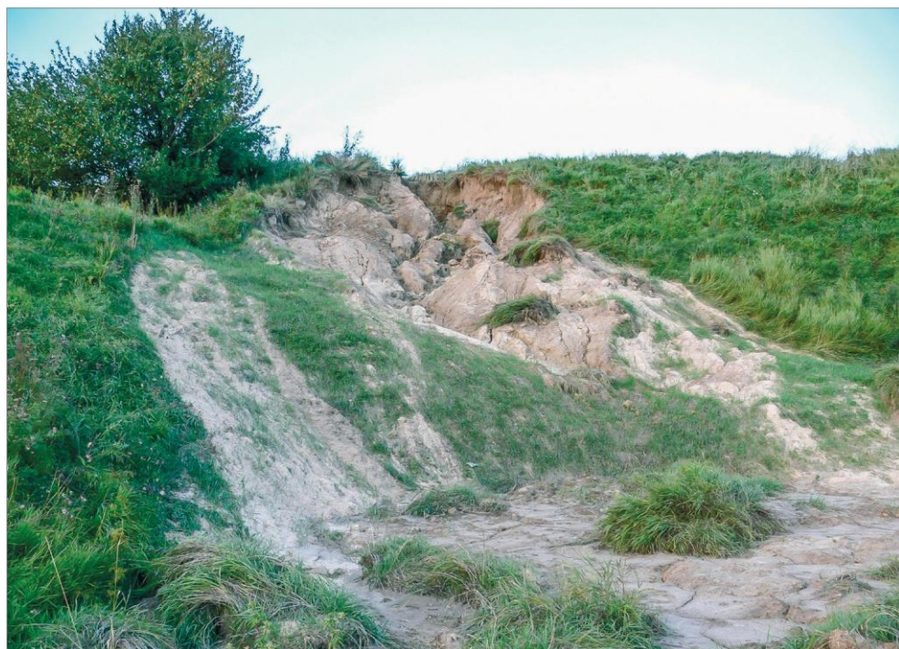
Ryc. 4b. Obsunięcie ziemi do wykopu po eksploatacji „białej gliny” (1997).